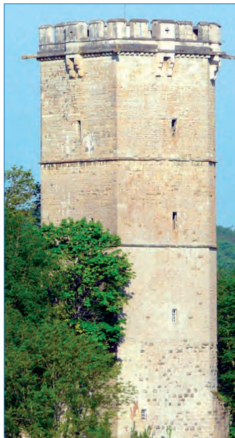
Tour de l'Aubespin