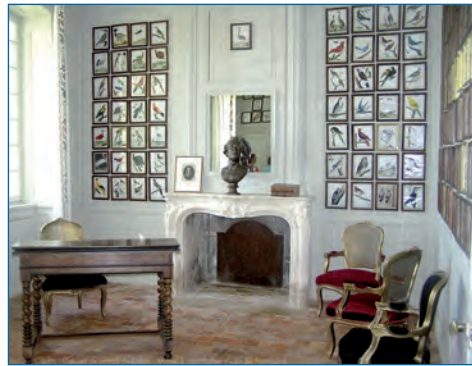
Cabinet de travail de Buffon

Musée & Parc Buffon Tél : 03 80 92 50 57 / 50 42 www.musee-parc-buffon.fr